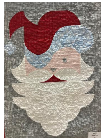
Patchwork : Chantal Beney

La municipalité a invité le Père Noël à apporter des brioches, friandises et oranges, à tous les enfants de l'école... sages et moins sages !