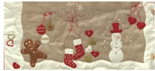
Patchwork de Martine Dupire (extrait)