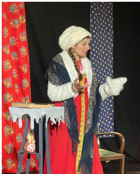
Zima : photo espace culturel Barbara

L'équipe enseignante, l'APE et la mairie agissent ensemble pour une fin d'année citoyenne, culturelle et animée ! Les enseignantes des trois cycles se mobilisent cette année encore pour le Téléthon , avec des actions adaptées à chaque âge. En novembre l'école a célébré la semaine du goût . Deux beaux spectacles ont eu lieu à la salle des fêtes dans le cadre du festival jeunesse Pépite Forêt. Un opéra loufoque pour les maternelles avec "Désordres et Dérangements" de la compagnie Une Autre Carmen. Une ouverture poétique à la culture russe pour les élémentaires, avec "Zima, contes des hivers slaves" de la compagnie La Futaie.